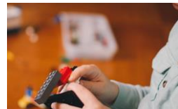
● ほいく侍(保育支援業務システム)