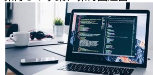
● ソフトウェア開発 (WEB系、組込制御)