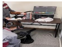
● VR溶接シミュレーター

訓練中は、難しい課題に頭を悩ませたり、就職できるのか不安になることもありましたが、同期の受講生達と相談しあったりしてモチベーションを維持することができました。同じ目標を持つ仲間がいることはとても心強かったです。