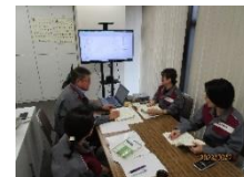
● 仕事風景(上司から指導)

将来的には、一級土木施工管理技士や技術士などの資格を取得し、橋梁のエキスパートになりたいです。