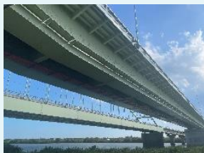
● 製品・製造現場(完成)

現在は札幌のオフィスで2D、3DCADを使用して橋梁の製作図等の作成を行っています。最近では工事現場の書類作成を現場監督の代わりに行う建設ディレクター業務も任されるようになりました。