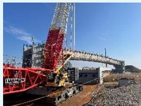
● 製品・製造現場(架設中)