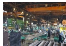
● 製品・製造現場(工場)