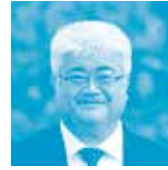
北海道職業能力開発大学校 生産電子情報システム技術科 職業能力開発教授 工学修士