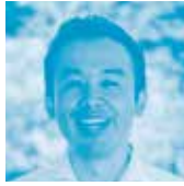
北海道職業能力開発大学校 電子情報技術科 職業訓練指導員 工学修士

IT教育の専門家がAI時代を迎えて変化する子どもの教育についてわかりやすく解説。実際に小学校で行われている授業内容だけでなく、これからの学びについても実践的内容でお伝えいたします。