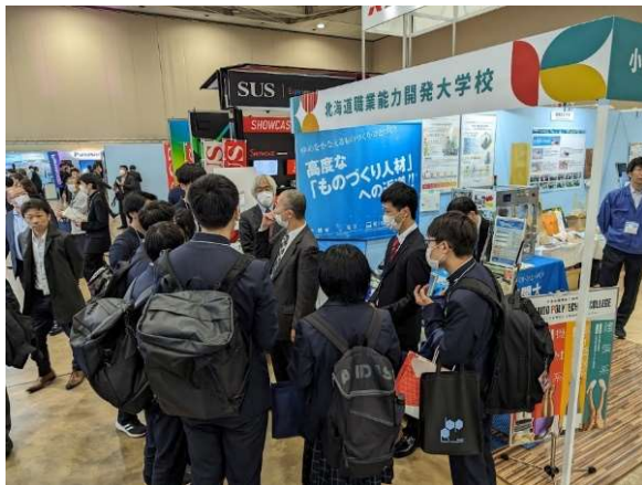
工業高校生への説明