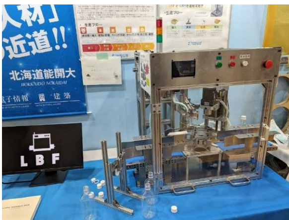
小型全自動飲料充填機 当校のユニークな取組、技術力を示す ことができたと感じます。