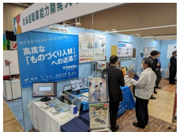
大学校ブースの様子 容器に充填するニーズは高く、様々な質問、 問合せがありました。