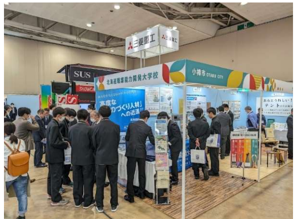
ブースの様子(工業高校生への説明)