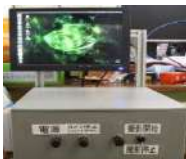
ねじ切り加工判定システム

昨年の先輩の資料を読み、数百行あるプログラムやメモなどを確認しながら、試行錯誤を繰り返すのは簡単なことではなかったが、自分の持っている知識をより深めることができたり、新たな知識を得ることができました。努力の過程は自分の力になったと思います。