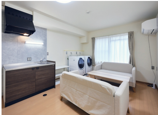
ランドリー&カフェスペース