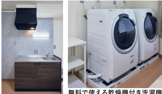
無料で使える乾燥機付き洗濯機

ランドリールームにカフェスペースを完備。寮生同士リラックスしながら、おしゃべりできる空間になっています。