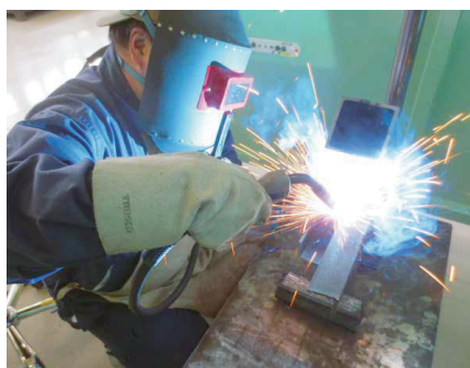
炭酸ガスアーク溶接