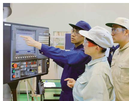
マシニングセンタ作業