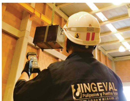
被覆アーク溶接・構造物運搬