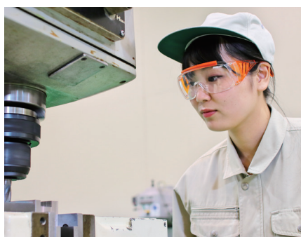
機械加工基本作業