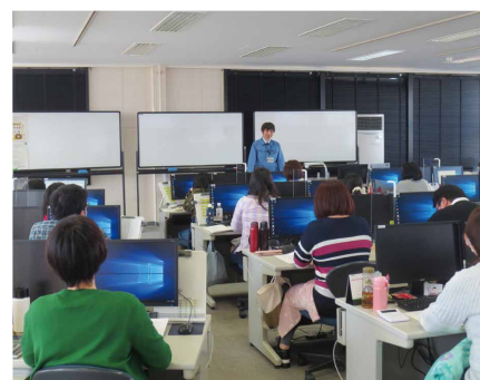
卸・小売業の経理実務