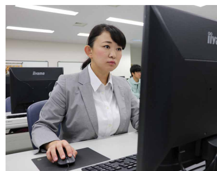
業種別帳票作成課題