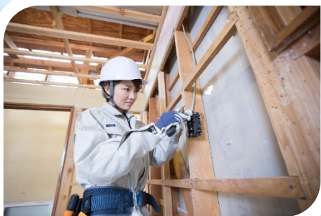
【電工テクノ科(施工コース)】