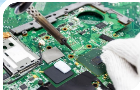
【デジタルエンジニア科】