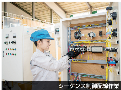
シーケンス制御配線作業