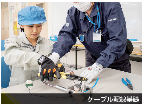
ケーブル配線基礎