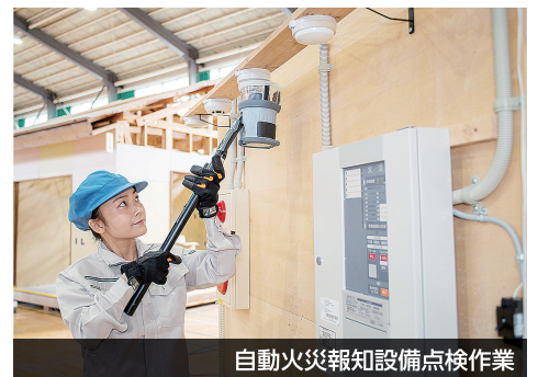
自動火災報知設備点検作業