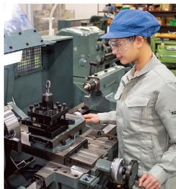
機械加工の基本を学ぶ汎用工作機械