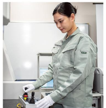
精密測定・機械検査