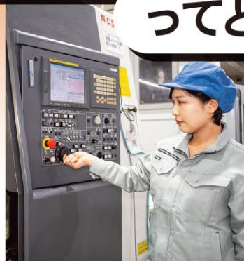
NC工作機械でマシンオペレート