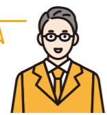
人材育成ご担当者