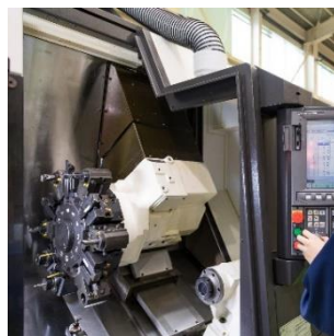
▲NC工作機械はプログラムどおりに機械が稼働する。