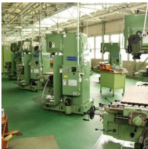
▲普通旋盤・フライス盤は1人1台の工作機械を用意している。

指導員になってからこれまでは、CAD/CAM科を担当してきました。CAD/CAM科ではCADで2次元の図面や3次元のモデルを作成する訓練を中心に担当しました。今年からは機械加工技術科の担当をしています。機械加工技術科ではまず、安全第一で訓練を行うこと、そしてものづくりの原点と言われる機械加工技術の面白さを受講生に丁寧に伝えるように努力しています。