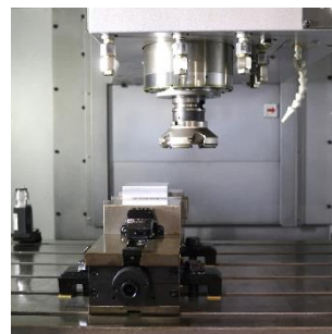
▲マシニングセンタは機械部品のほか金型などを製作するときなどに用いられる機械