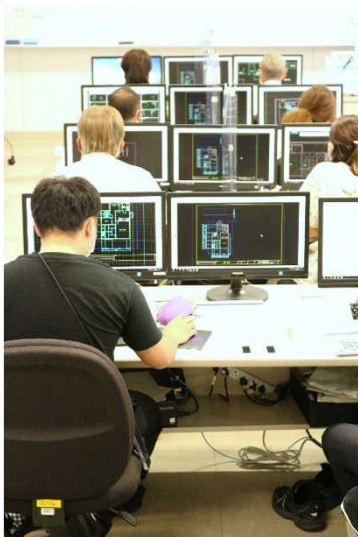
▲ CAD訓練の様子。受講者間のモニターには、指導員のモニターが映し出され、細かい部分まで確認できる。