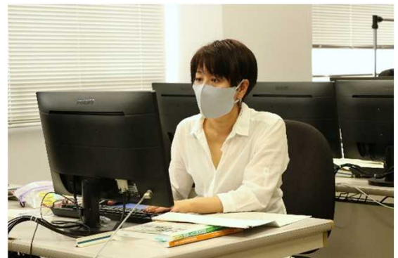
▲ 訓練受講 2 か月目。木造建築の平面図をCADで作成に取り組む