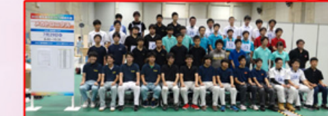
メカトロニクス職種に出場した選手たち