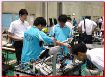
メカトロニクス前目の確認