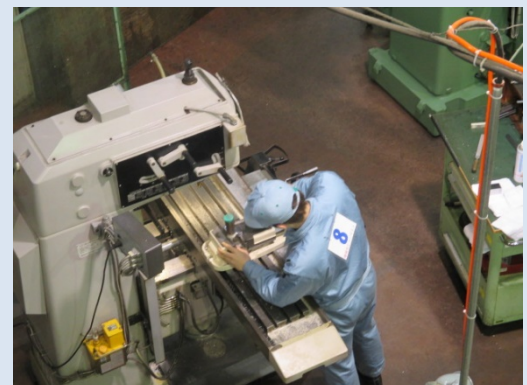
加工技術コンテスト競技会風景