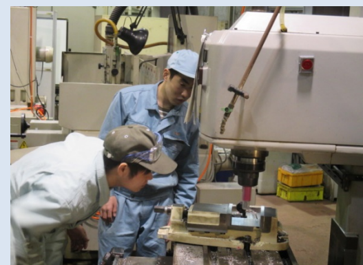
先輩から「勾配だし」の指導