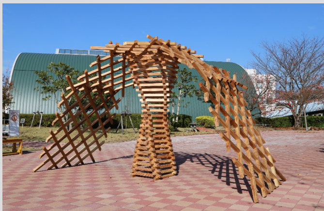
製作品「人と人を繋げるアーチ」