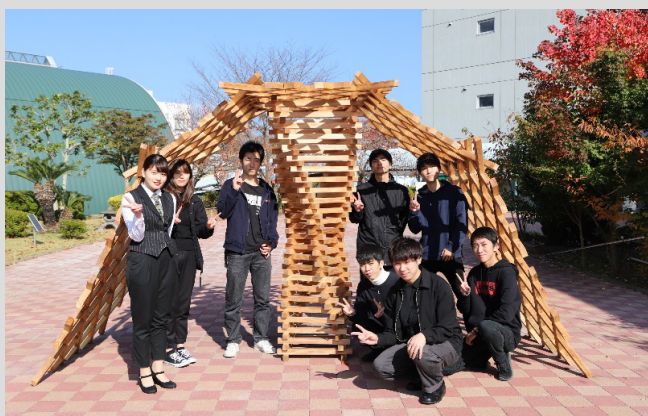
テーマとして取組んだ3名と 製作に関わったメンバー