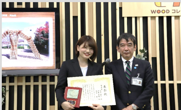
東京ビックサイトにおける受賞式参加 学生(左)と大会関係者

東京ビックサイトで開催されたWOODコレクション(モクコレ)2019。会場エントランスに開催期間中展示されるエントランスモニュメントの学生デザインコンテストに建築科2年の3名が応募し、製作した作品が優秀賞に選ばれました。モクコレ開催初日に表彰式が執り行われ3名を代表して建築科の一人が代表として出席しました。(およそ20組の応募。最優秀賞1組、優秀賞2組)