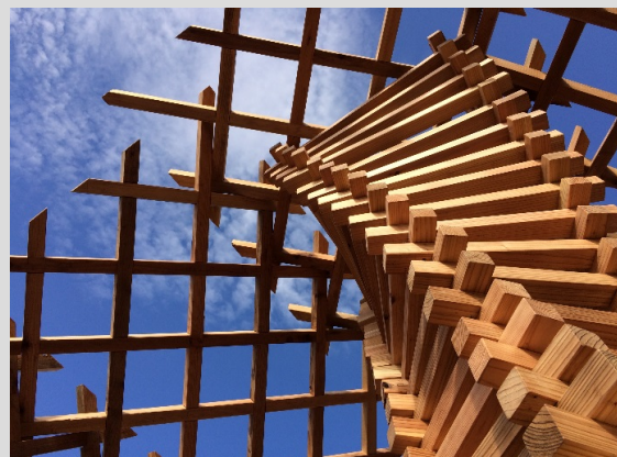
地獄組(本捨組)の木組み