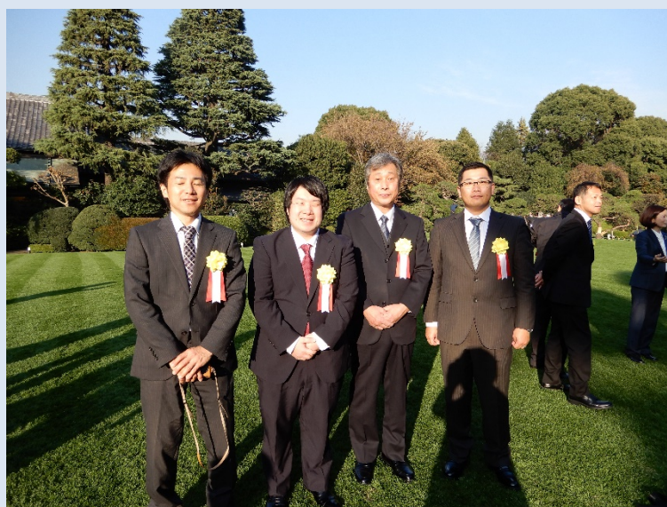
共同研究のメンバー