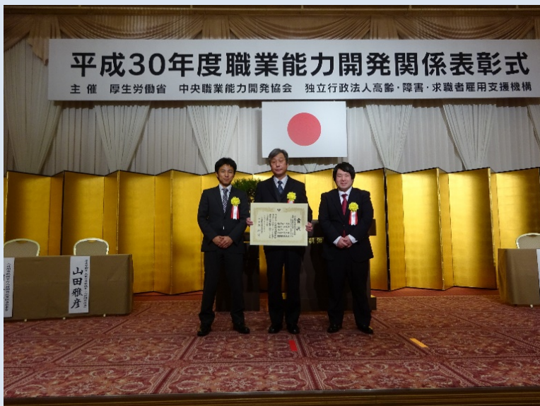
表彰式の実施風景