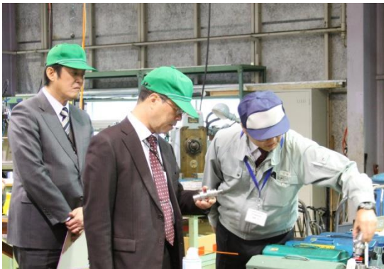
生産技術科実習場にて