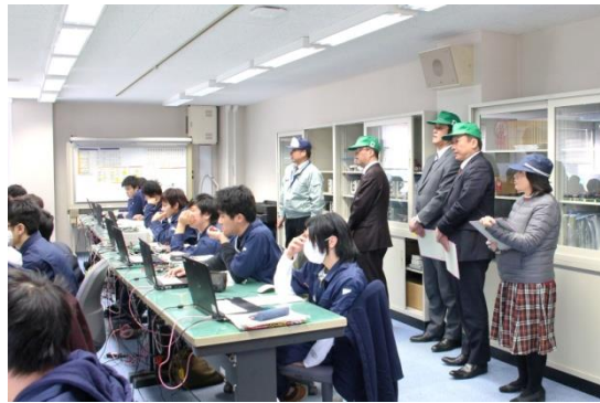
電子情報技術科実習室にて