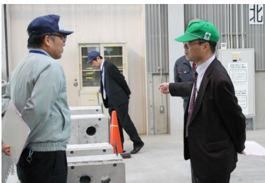
建築施工システム技術科実習場にて