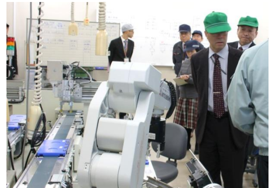
電気エネルギー制御科実習場にて