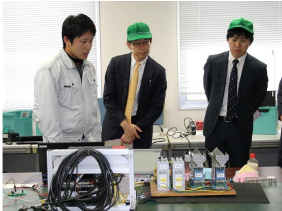
共同研究「計量システム装置」開発室