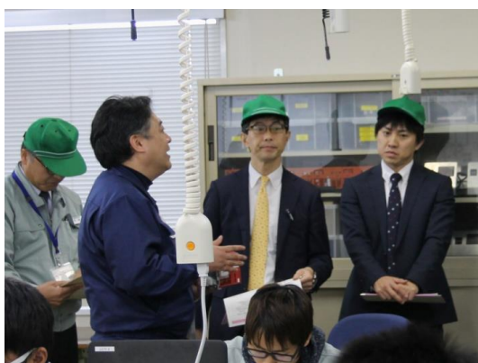
電気エネルギー制御科実習室