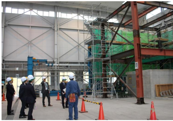
建築施工システム技術科実習場