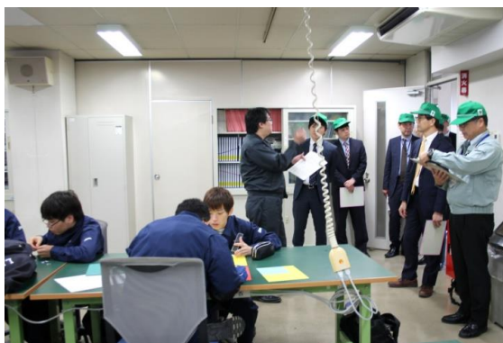
電子情報技術科実習室