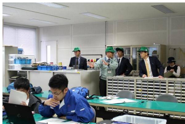
生産電気システム技術科実習室