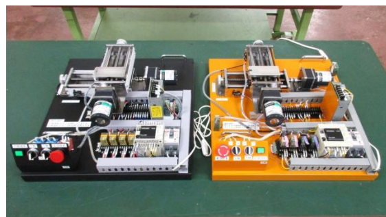
4グループの製作品