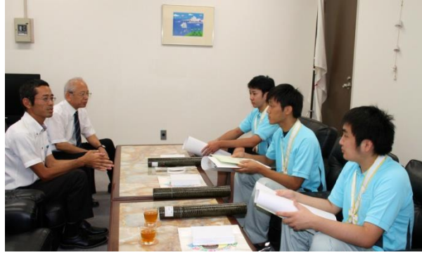
受賞選手との懇談