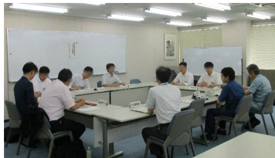
勉強会開講式と概要説明