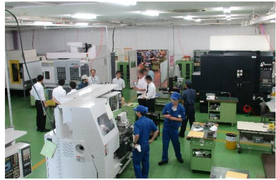
機械加工実習場の見学