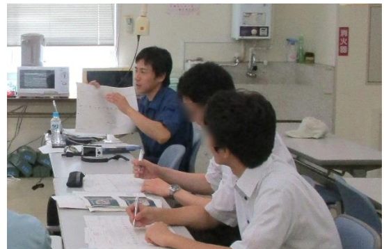
トレーニングの事例紹介と意見交換