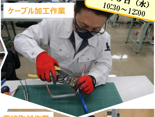
ケーブル加工作業