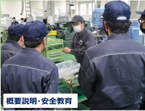
概要説明・安全教育