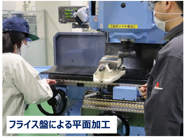
フライス盤による平面加工