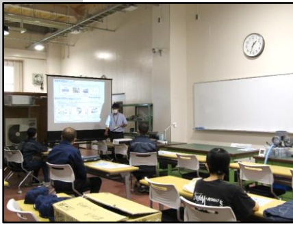
設備管理の仕事の魅力説明

電気・エアコン・水回り・消防・ボイラー設備の施工・設置・保守の仕事内容を実機を見ながらより詳しく知って頂き、設備管理の仕事の魅力を感じていただきます。(1時間半程度)