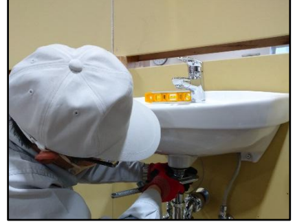
給排水設備の訓練内容の説明

体験会に参加すると 求職活動の実績 になります！ 雇用保険受給資格者証をお持ちの方は体験会当日ご持参下さい。