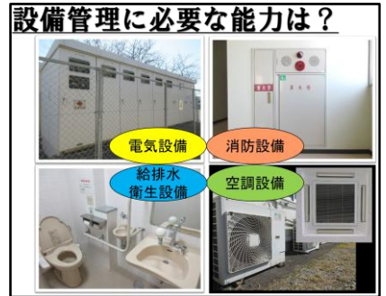
設備管理の仕事内容の説明