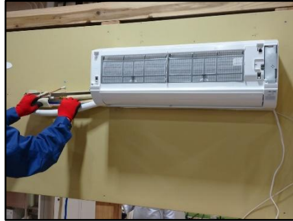
空調設備の訓練内容の説明