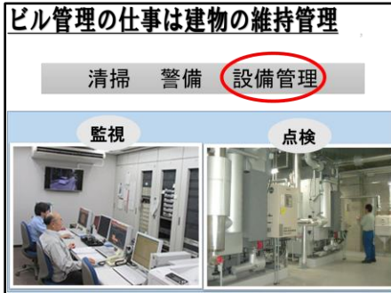
ビルメンテナンスの仕事内容の説明