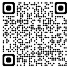
〔関連職種紹介〕 配電盤・制御盤組立