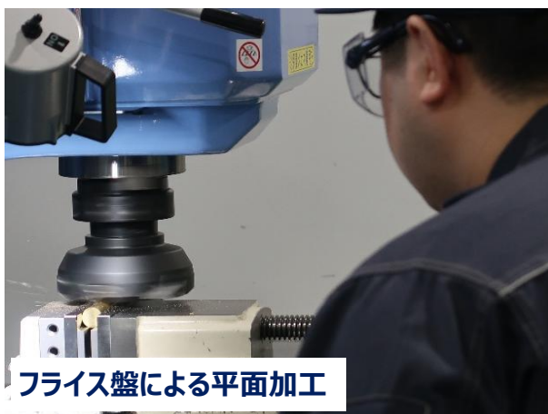
フライス盤による平面加工