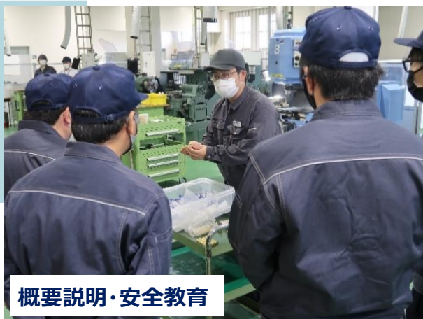
概要説明・安全教育

工作機械等による加工体験を通じて、真鍮製の写真立てを完成させます（1時間半前後）