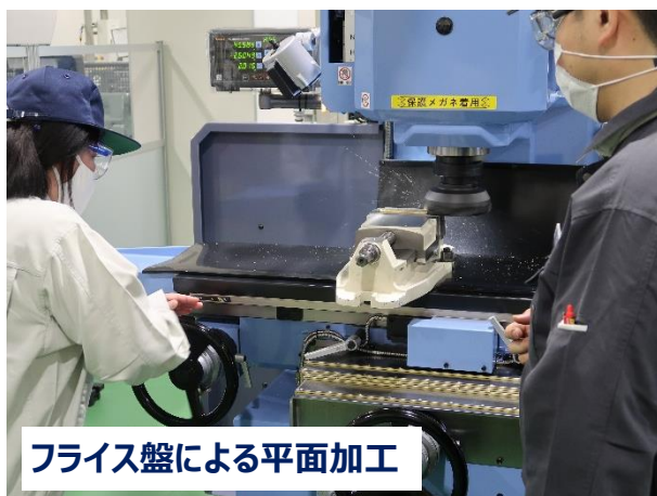
フライス盤による平面加工