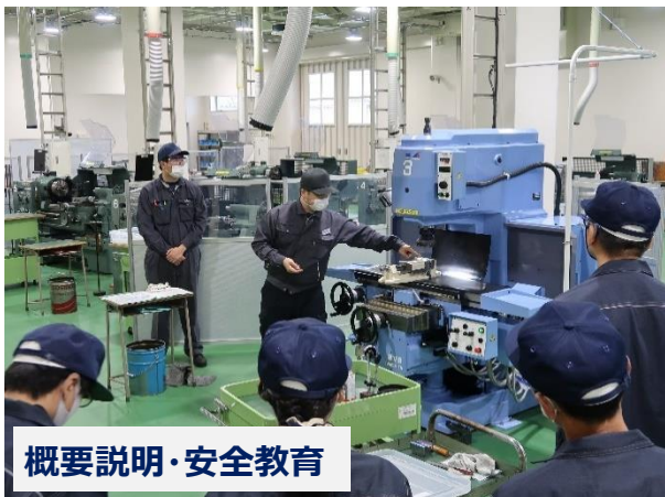
概要説明・安全教育

工作機械等による加工体験を通じて、アルミ製の箸置きを完成させます（1時間半前後）