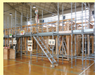
▲木造住宅の新築工事