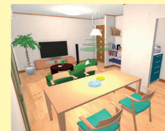
▲3次元CADによる内観パース