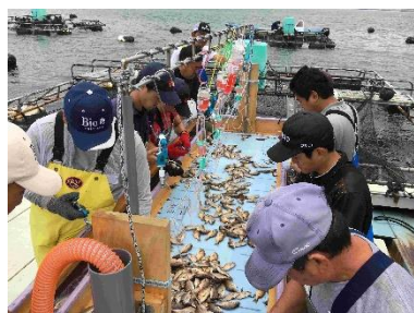
養殖魚へのワクチン接種作業