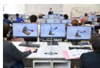
教室での訓練の様子