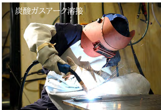
炭酸ガスアーク溶接