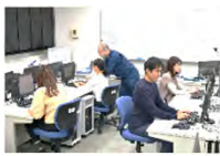
教室での訓練の様子