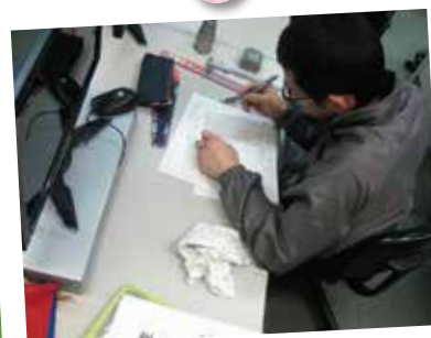
図面の見方・測定