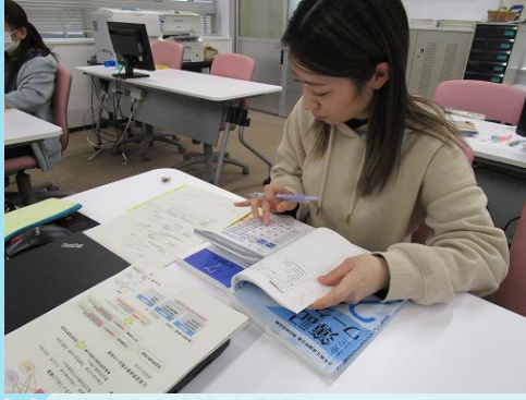
【CADものづくりサポート科】