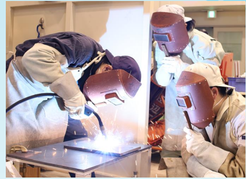
【溶接エンジニア科】