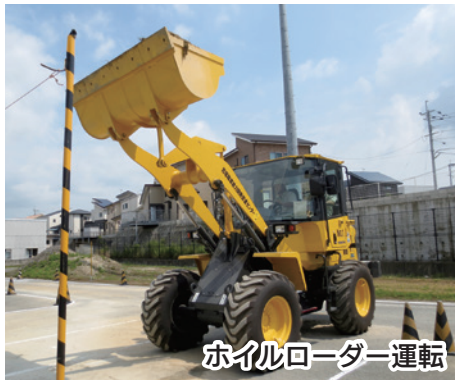
ホイールローダー運転