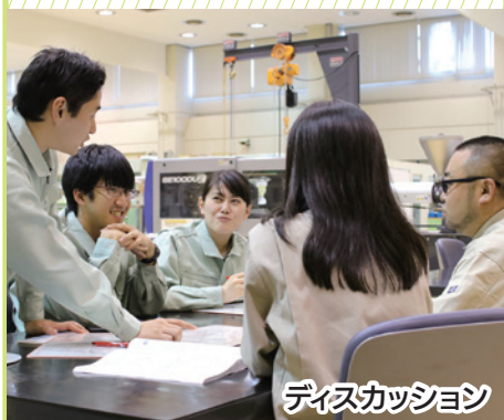
ディスカッション