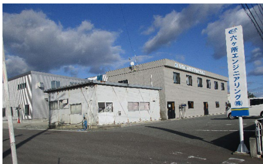
写真:六ヶ所エンジニアリング株式会社 外観

六ヶ所エンジニアリング株式会社(青森県上北郡六ヶ所村)は石油プラントメンテナンス、原子力関連施設メンテナンス、各種公共工事及び民間工事、製作加工事業、ドローン事業といった多種多様な事業を展開する企業である。