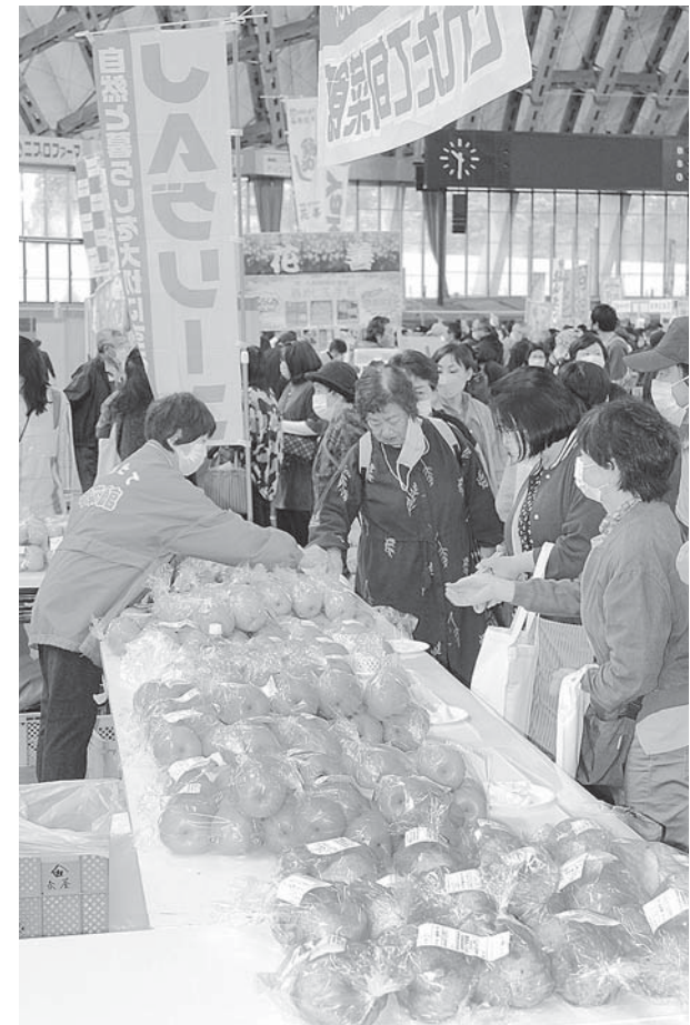
地場産の果物が並んだブース