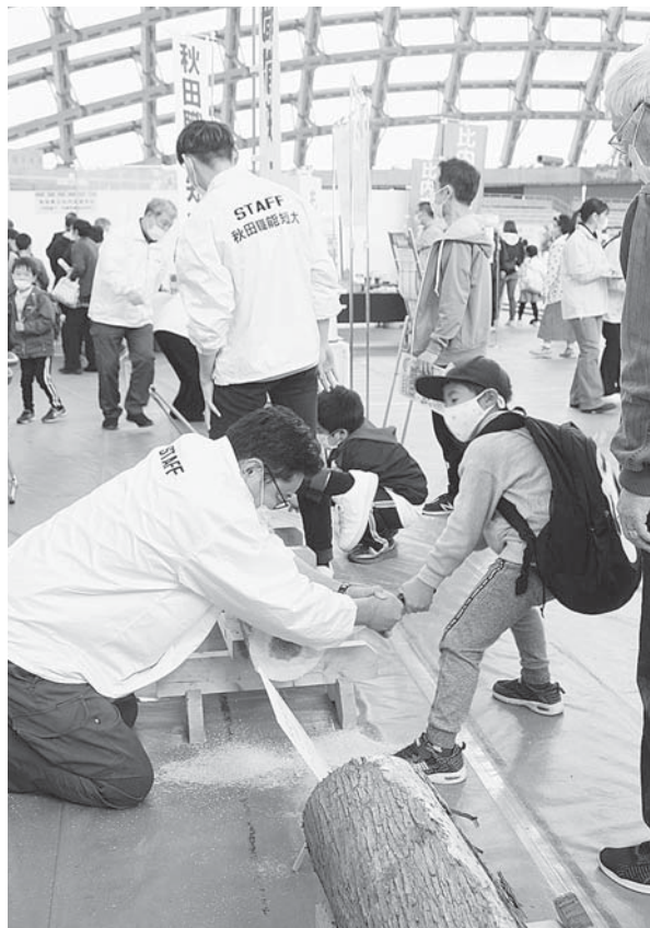
丸太切り体験に挑戦する子ども