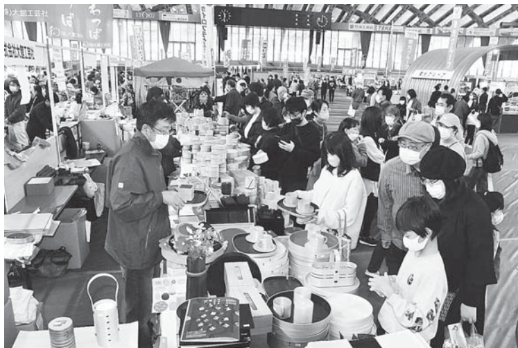
物販ブースには特産品も並び、人気を集めた