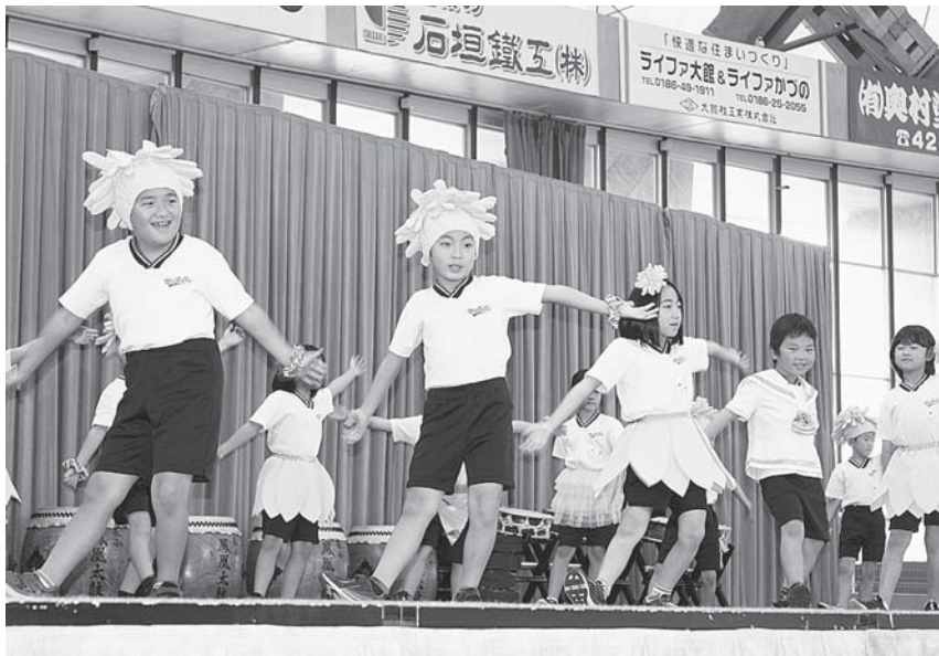
かわいらしいダンスを披露する長木小児童