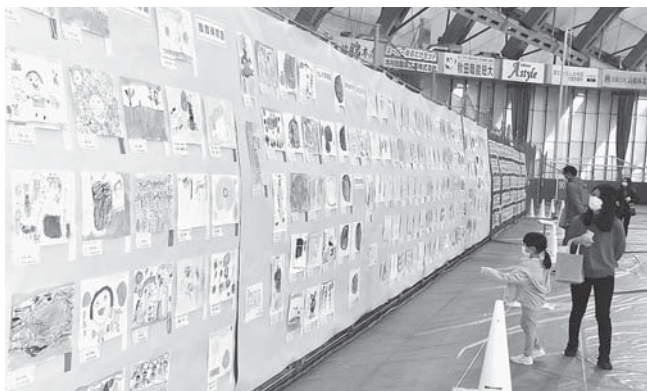
図画・書写展では、園児や児童の作品がずらりと並んだ

第24回大館圏域産業祭は22、23日の2日間、大館市のニプロハチ公ドームで開かれた。2018年度以来4年ぶりの開催で、展示販売、体験企画、ステージイベントを楽しむ人でにぎわった。会場の様子を写真で紹介する。