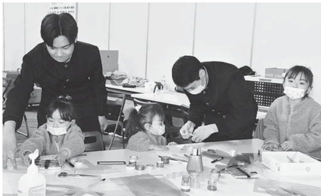
ものづくり体験では高校生らが指導役を担った