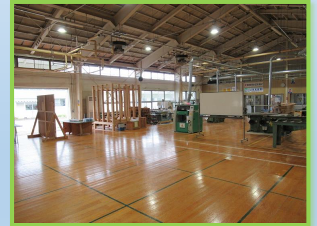
広い実習場で換気の徹底