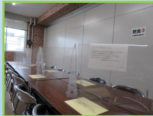
休憩時の黙食・距離の確保