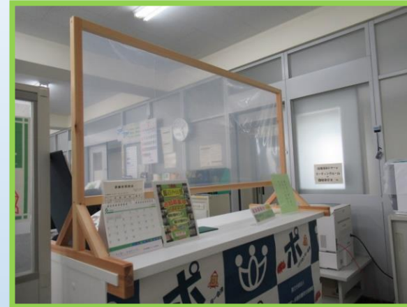
本館受付にパーテーションの設置