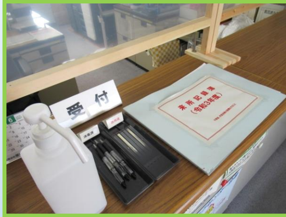
来所記録簿への記入のお願い