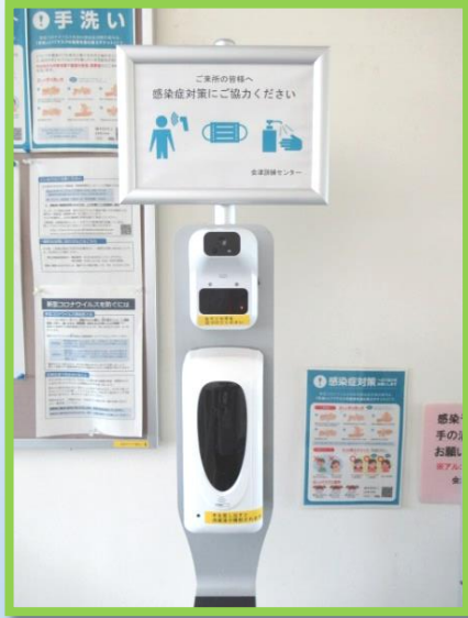
非接触型の検温器・ 手指用消毒装置の設置