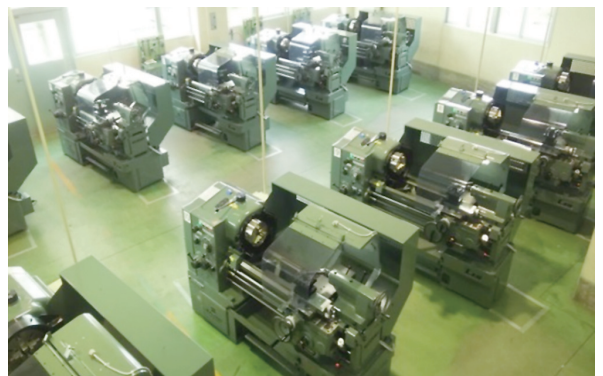
普通旋盤：DMG森精機(株)LEO-80A