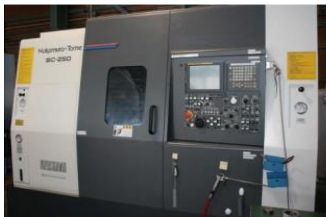
使用機器：NC旋盤 中村留精密工業(株) SC-250 制御装置：FANUC