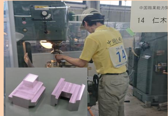
フライス盤加工職種の競技の様子