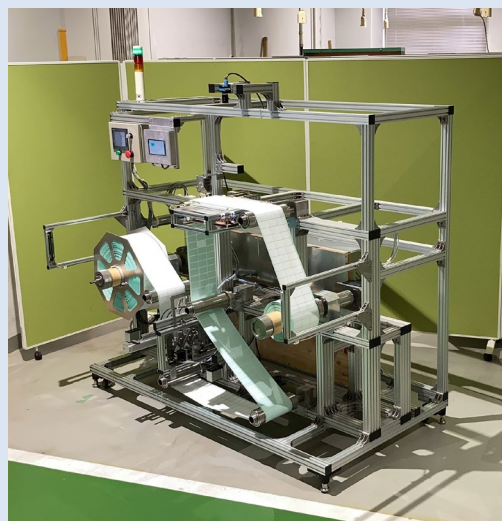
図1.ラベル欠品検査装置

センサの移動時は、ラベル中央に等間隔に配置する必要があるため、図2に示すようにマジックハンドをヒントとしたリンク機構を考案し製作した。撮影部では、画像処理を活用することでラベルの中心点を算出し、リンク機構を原点から中心点へ移動させることで、欠品検知センサの自動位置調整機能を実現された。