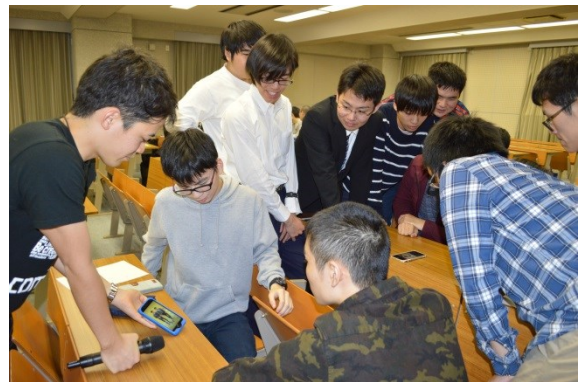
スマホを使って皆でアプリの体験しました