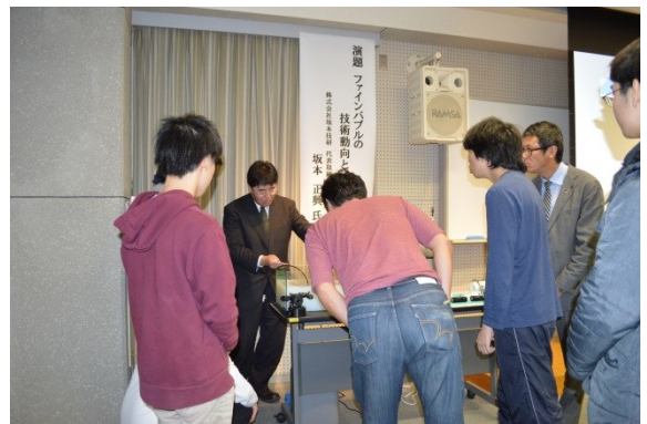
参加者は実演に興味津々です