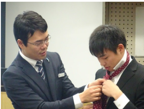
ネクタイの結び方を習います。