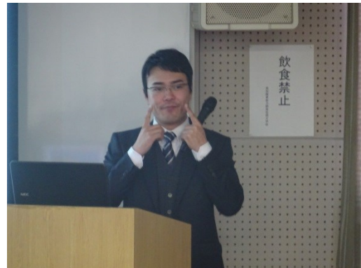
第一印象は3分で決まります。口角を 上げて笑顔で。