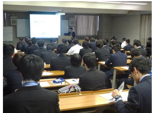
初めての就職活動に向けて皆真剣です。