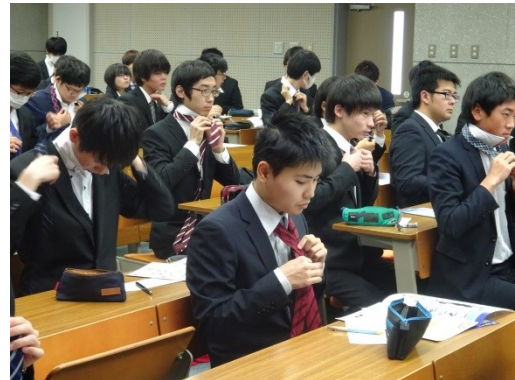
皆もチャレンジします。上手く結べる様 になったかな。