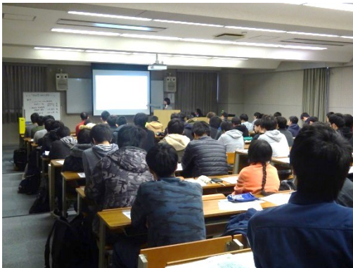
会社概要の説明も真剣に聞き理解を深めます。