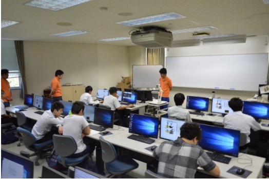
模擬授業「銅板キーホルダーを作ろう！」に参加