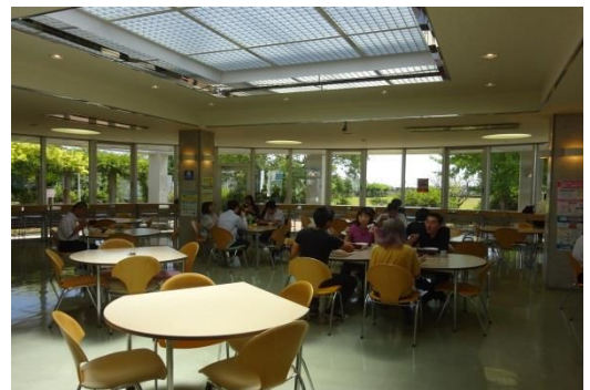
ランチのお味はいかがでしたか？

今回参加して下さった皆様ありがとうございました。今回参加できなかった方で、高知能開短大ニュースを見て興味を持って下さった方も是非一度ご参加下さい。次回オープンキャンパスは12月17日です。見て体感していただき、当校を知っていただければと思います。また、9月24日には入試対策講座もあります。入試のポイント解説や模擬試験と解説を行いますので、入試を希望される方は是非ご参加下さい。皆様のご参加お待ちしております。