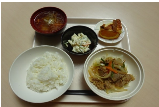
今回のランチは野菜炒め定食。シフォンケーキ付でした。