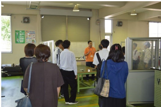
生産技術科の加工実習室の見学会