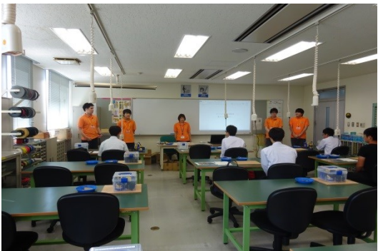
模擬授業「電子ホッケーを作らう！」に参加