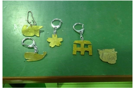
キーホルダー完成しました。