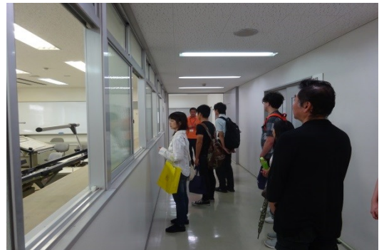
今では珍しくなったドラフターのある製図室も見学。