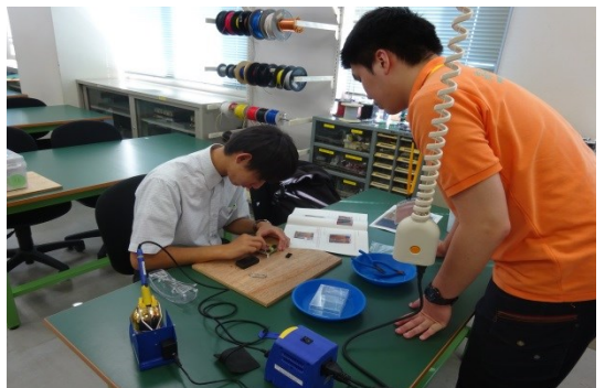
分からない所は、在学生がアドバイスしてくれます。