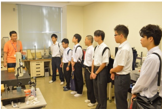
精密測定室で測定器の説明を聞きます。