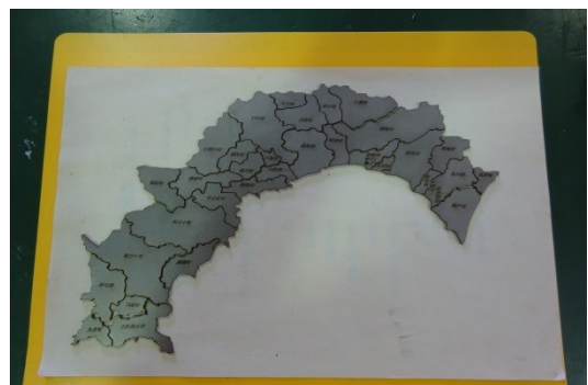
ステンレス板をレーザーで加工した高知県の市町村パズル。