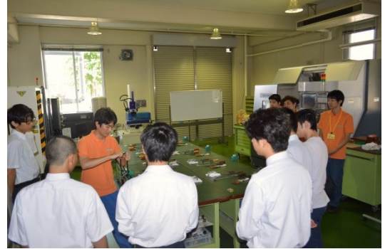
先生に金切りノコギリの使い方のレクチャーを受けています。