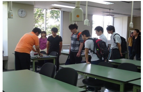
興味ある説明に耳を傾けます。