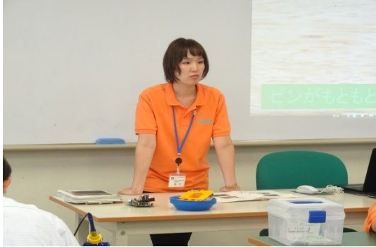
電子情報技術科の瀧内先生。先生の表情も真剣です。