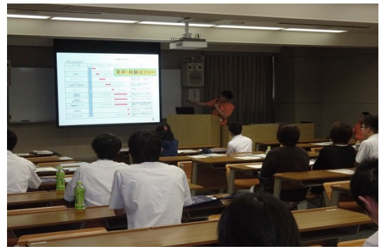
学務援助課長より学校についての説明