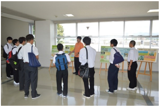
今までの総合制作課題の説明を聞いています。