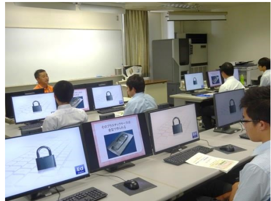
ミニミニ体験 設計！を体験中。