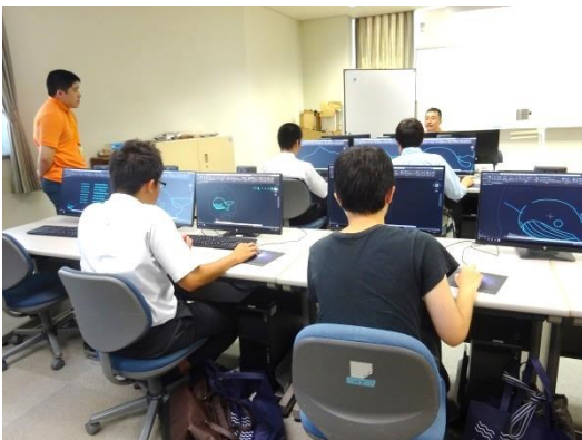
体験授業「メダルを作ろう！」に参加。