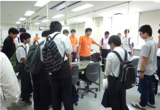
電子情報技術科の学生による科の紹介