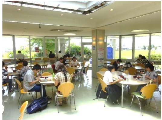
皆さんお味はいかがでしたでしょうか？