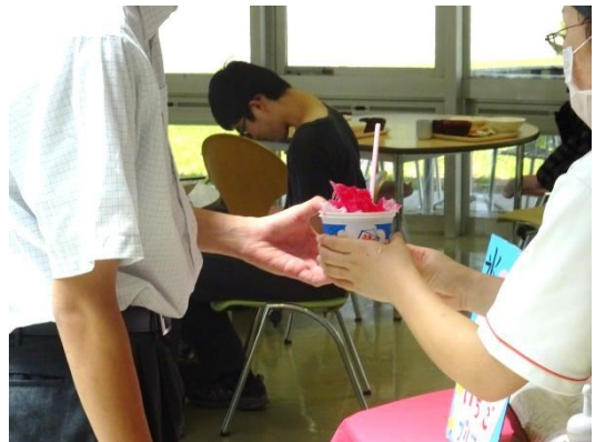
かき氷。美味しかったかな。

今回参加して下さった皆様ありがとうございました。今回参加できなかった方で、高知能開短大ニュースを見て興味を持って下さった方も是非一度ご参加下さい。今後の日程は9月10日、12月17日です。見て体感していただき、当校を知っていただければと思います。また、9月24日には入試対策講座もあります。入試のポイント解説や模擬試験と解説を行いますので、入試を希望される方は是非ご参加下さい。皆様のご参加お待ちしております。