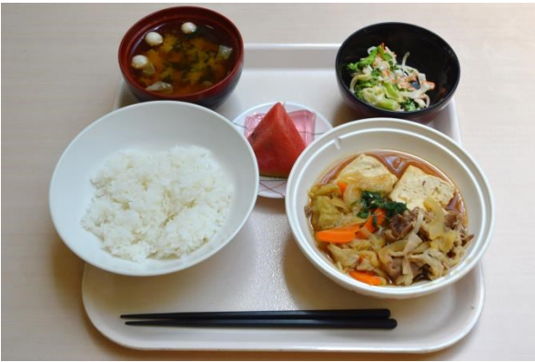
今回の満腹ランチは、肉豆腐セットでした。