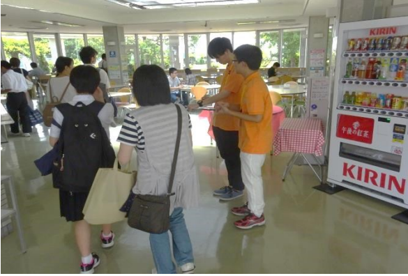
ランチ体験のチケットを学生が回収します。