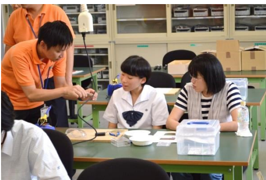
女子生徒にも分かりやすく教えてくださいます。