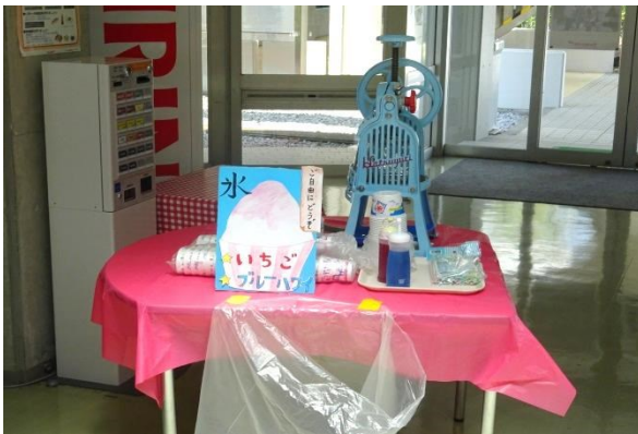
この夏、最後のかき氷。