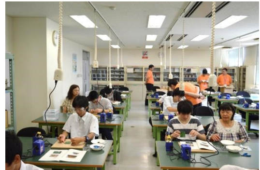
ミニミニ体験「組み込み！」を体験中。