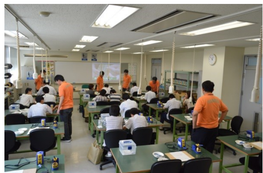
学生もアドバイスしてくれます。