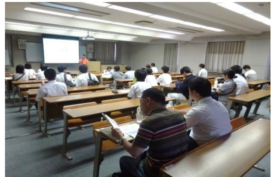
能力開発部長より学校についての説明