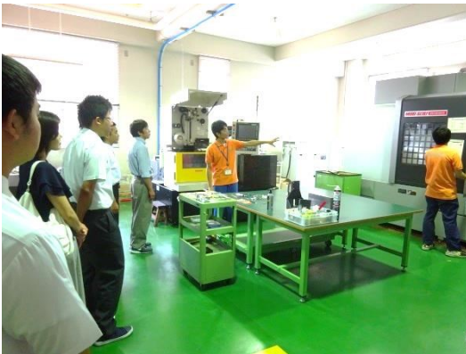
生産技術科の見学会