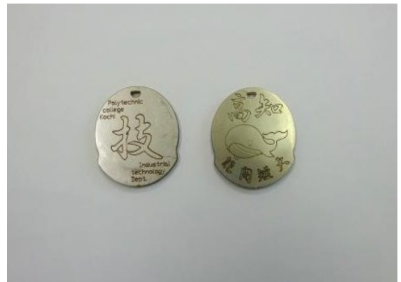
体験授業のメダル。上手に出来ました。