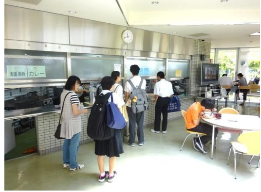
順番に並んでランチを取り、席に移動します。